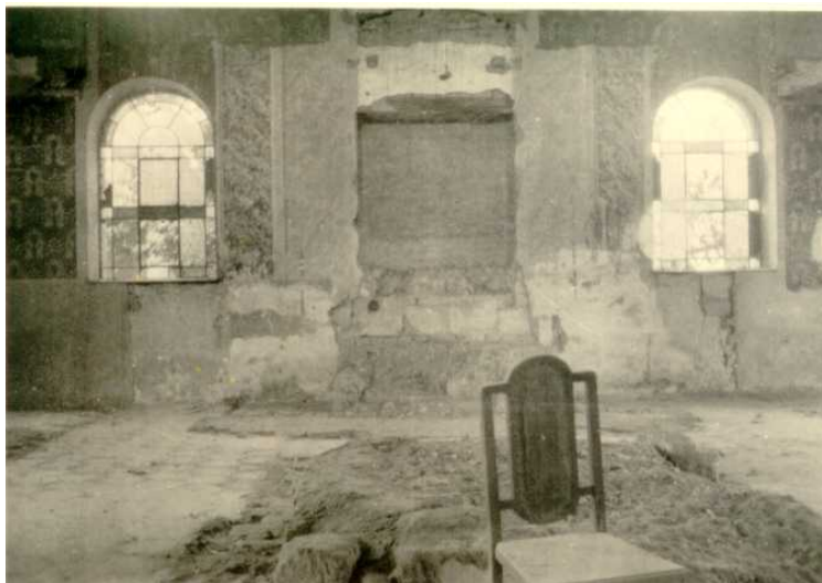
A zsinagóga belseje a front után.