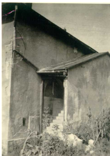
A zsinagóga egy részlete kívülről a vészkorszak után.