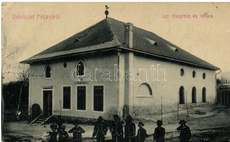
A zsidó elemi iskola.